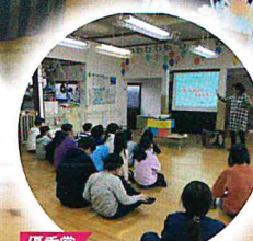
優秀賞 表現力・防災力向上！ 地域防災演劇ワークショップ