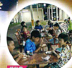
奨励賞 Cafeで家族の様に 愛され育つ子どもたち