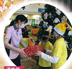
優秀賞 クリスマスに笑顔を届ける、 みんなレモサンタ