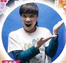
優秀賞 手話で自分と他者が 分かり合い豊かに生きる