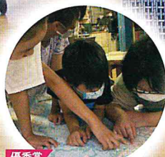
優秀賞 35年続く「自分である」ことが 嬉しい空間