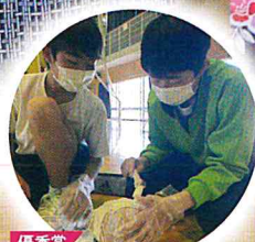
優秀賞 ともにつくろう白石の未来 ～White Will(しろい志)～