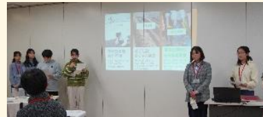
2/24 おやま「つながり」の場