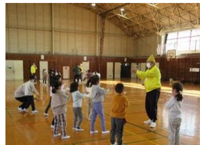
2024年1月12日 城東小学校1年生A「エコトンボ」

竹馬に挑戦して最後には乗れるようになる子ども、夢中になって手作り遊びを作る親子、懐かしいベーゴマに心を躍らす年配の人たちも、それぞれが「できる喜び」を味わう機会になります。