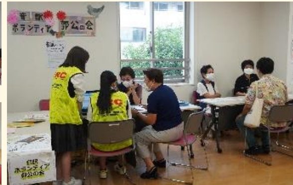
9/10 おやま〜る“ふれあい”イベント