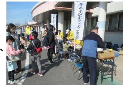
2024年2月10日 マルベリー館まつり

牛乳パックで作る「エコトンボ」、焼酎などの厚紙で作る「びゅんびゅんごま」、紙コップで作る「紙コプター」は、SDGsな取り組みでもあり、最近は大活躍しています。