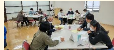
2/25 Movie de ダイアログ